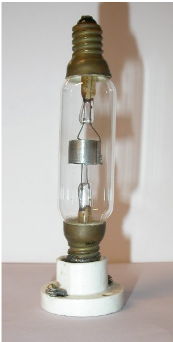
Erbee lamp van Radio Bussum - 1920 -